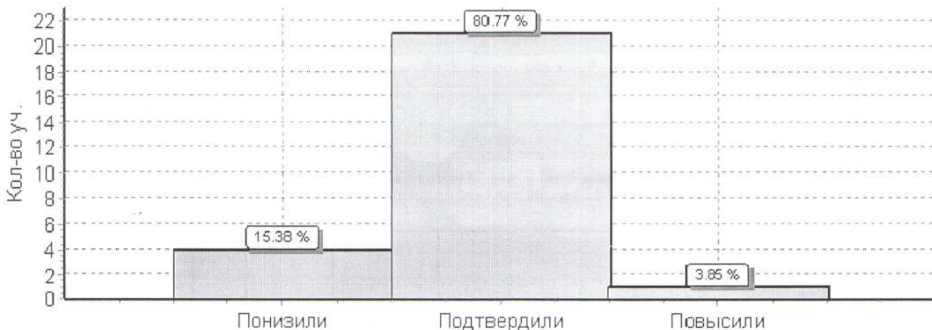
Гистограмма соответствия отметок за выполненную работу и отметок по журналу