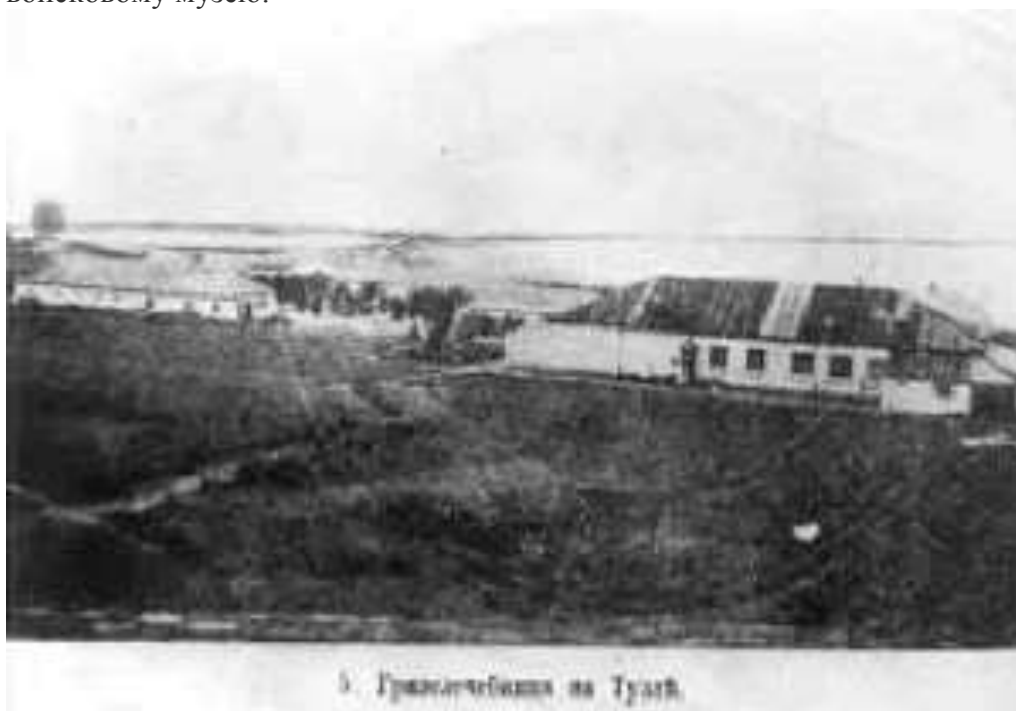
Грязелечебница на косе Тузла

После смерти Евгения Фелицына, основателя нынешнего Краснодарского государственного историко-археологического музея, вся музейная библиотека, собранные документы и фотографии стали расходиться в частные коллекции. В 1909 году был издан приказ Михаила Бабыча о комплектовании личного архива Фелицына и передачи его войсковому музею.