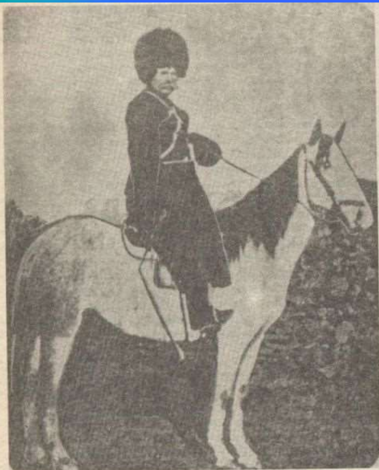
Генерал П. Д. Бабыч на боевом коне